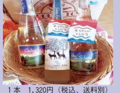
Cidre de Sobetsu (ドライ) 内容量500mL (辛口・アルコール 6%)