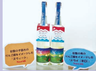
Cidre de Sobetsu (スイート) 内容量500mL (甘口・アルコール 4%)