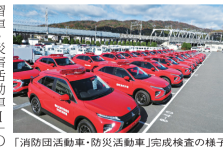
消防団活動車・防災活動車Ⅰ完成検査の様子

日本消防協会では、全国各地の消防団に対し、「消防団活動車・防災活動車」と「消防団防災学