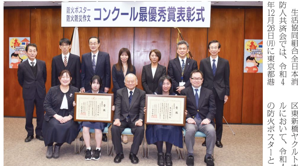
令和4年度の防火ポスターと「防火防災に関する」作文コンクールの最優秀受賞者、学校関係者、受賞者のご家族と表彰式列席者

生活協同組合全日本消防人共済会では、令和4年12月26日(月)に東京都港区東新橋ヤクルト本社ビルにおいて、令和4年度の防火ポスターと「防火防災に関する」作文コンクールの最優秀表彰式を行いました。