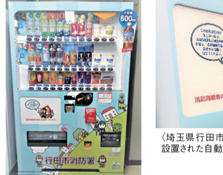
埼玉県行田市消防本部に設置された自動販売機

消防育英会では平成26年度から消防育英会支援自動販売機事業を行っています。総務省をはじめ、全国の消防本部、消防署、消防団を中心に132団