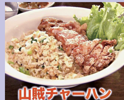
山賊チャーハン 1,000円(税込)