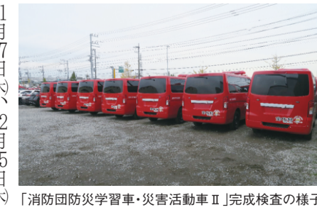
消防団防災学習車・災害活動車Ⅱ完成検査の様子