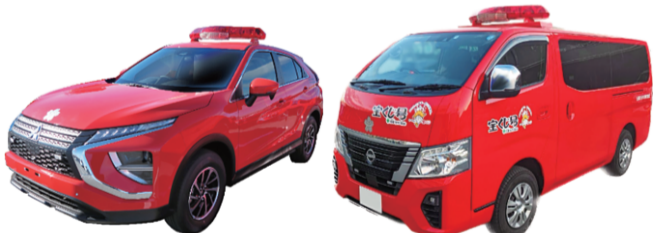
消防団活動車・防災活動車 (SUV型) 消防団防災学習・災害活動車Ⅱ (ワンボックス型)

ワンボックス車については、一般財団法人日本宝くじ協会の補助を受け交付させて頂いております。