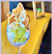
奈良井ブラウンパフェ