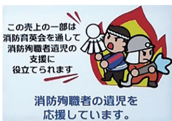
この売上の一部は消防育英会を通して消防殉職者の遺児の支援に役立てられます。消防殉職者の遺児を応援しています。

(公財) 消防育英会では、消防育英事業の安定的な運営に資することを目的に、平成26年度から消防育英会支援自動販売機を導入しています。この自動販売機は、売上の一部(1本当たり原則2円)を消防育英会にご寄付いただくもので、消防育英会にとって貴重な財源となっております。平成26年12月に第1号機が設置されて以来、着実に増加を続け、おかげをもちまして