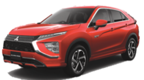
※朱色塗装を施し、LED式散光蛍光灯などを装備します。