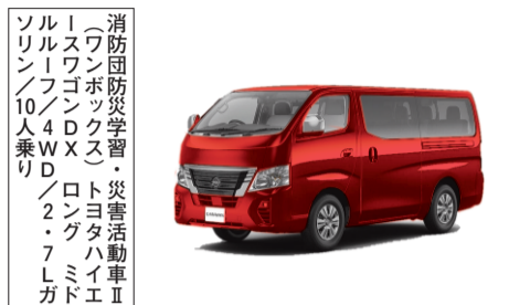
※朱色塗装を施し、LED式散光蛍光灯などを装備します。

(公財) 日本消防協会は、約79万人の会員の福祉厚生に消防団活動の充実を図るとともに、地域住民の皆様が安心して防災活動に参加できるように、各種の共済事業を実施しております。