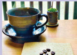
ハンドドリップ珈琲