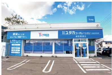
釧路愛国店さん(営業部)

【店舗名】株式会社ユタカコーポレーション 【業態】不動産関係 【本社所在地】北海道釧路市光陽町13番20号 【営業部所在地】北海道釧路市愛国西1丁目31番16号 【本社連絡先】0154-231-2255(代) 【営業部連絡先】0154-391-3949 【サービス内容】賃貸仲介料20%割引 賃貸などのご相談があれば、ユタカコーポレーションへご連絡ください。