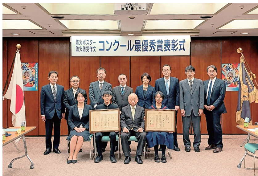
令和5年度の防火ポスターと「防火防災に関する」作文コンクールの最優秀賞受賞者、学校関係者、受賞者のご家族と表彰式列席者