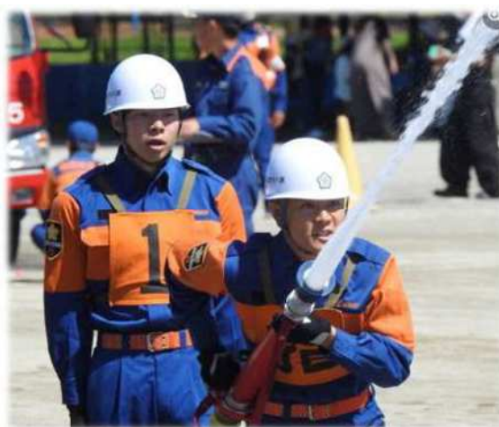
《6月》諏訪市ポンプ操法大会